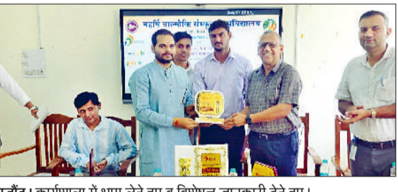
राजौद। कार्यशाला में भाग लेते हुए व विशेषज्ञ जानकारी देते हुए।

‘मेरा युवा भारत’ कैथल द्वारा महर्षि वाल्मीकि संस्कृत विश्वविद्यालय में प्लैगशिप योजनाओं पर एक दिवसीय कार्यशाला का सफलतापूर्वक आयोजन किया गया। इस कार्यशाला का उद्देश्य युवाओं को भारत सरकार की प्रमुख योजनाओं के प्रति जागरूक करना एवं उन्हें आत्मनिर्भर बनने के लिए प्रेरित करना रहा। कार्यक्रम का शुभारंभ दीप प्रज्वलन के साथ हुआ, जिसमें मुख्य अतिथि प्रो.