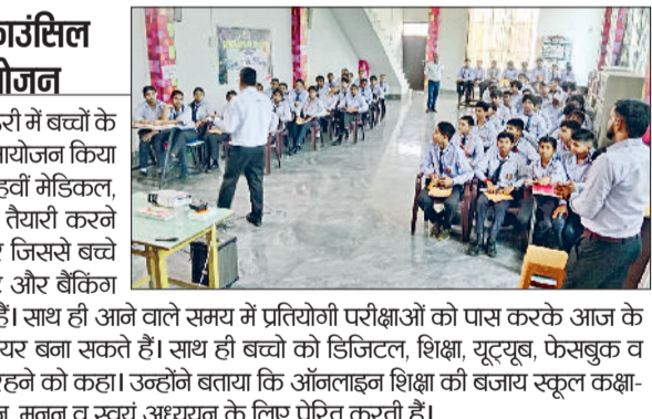
श्वेता स्कूल में करियर काउंसिल संगोष्ठी का किया आयोजन

पूंडरी। श्वेता रॉयल पब्लिक स्कूल पूंडरी में बच्चों के लिए करियर काउंसिल संगोष्ठी का आयोजन किया गया। इसमें कक्षा नवमी से कक्षा बारहवीं मेडिकल, नॉन मेडिकल, कॉमर्स स्ट्रीम के लिए तैयारी करने के बारे में अवगत करवाया गया और जिससे बच्चे भविष्य में बच्चों को जेई एडवांस, नॉट और बैक का क्षेत्र में अच्छे करियर बना सकते हैं। साथ ही आने वाले समय में प्रतियोगी परीक्षाओं को पास करके आज के स्पर्धात्मक युग में अपना अच्छे करियर बना सकते हैं। साथ ही बच्चों को डिजिटल, शिक्षा, यूट्यूब, फेसबुक व सोशल मीडिया के दुष्प्रभावों से सचेत रहने को कहा। उन्होंने बताया कि ऑनलाइन शिक्षा की बजाय स्कूल कक्षा-कक्ष की पढ़ाई बेहतर है जो हमें चिंतन, मनन व स्वयं अध्ययन के लिए प्रेरित करती है।