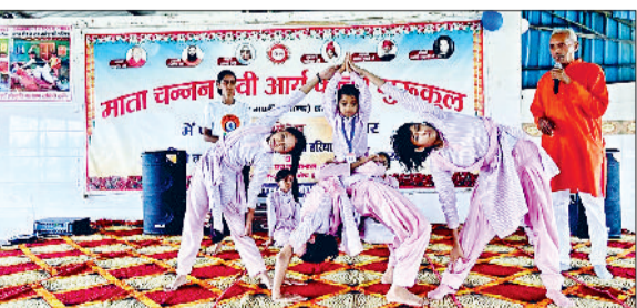
जीद। शिविर में योगासन कर दिखाते छात्राएं।