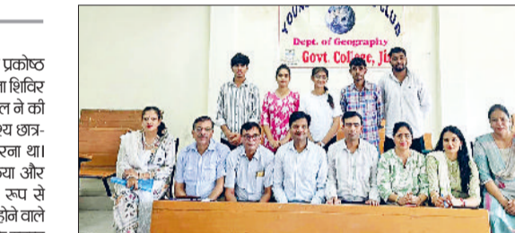
जीद। युवा भूगोल संघ के चयनित पदाधिकारी।