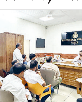
उपभोक्ताओं की फैमिली आई.डी. में वार्षिक आय 1 लाख 80 हजार रुपये तक है, उन्हें केंद्र सरकार

की ओर से 60 हजार रुपये और राज्य सरकार की ओर से 50 हजार रुपये की सब्सिडी दी जाती है। वहीं, जिनकी आय 1 लाख 80 हजार से 3 लाख रुपये के बीच है, उन्हें केंद्र सरकार से 60 हजार और राज्य सरकार से 20 हजार रुपये की सब्सिडी का लाभ मिल रहा है। उन्होंने यह भी स्पष्ट किया कि इस योजना का लाभ उन्हें उपभोक्ताओं को मिलेगा जिनकी अप्रैल 2024 से 31 मार्च 2025 तक कुल बिजली यूनिट की खपत 2400 यूनिट से कम होगी।