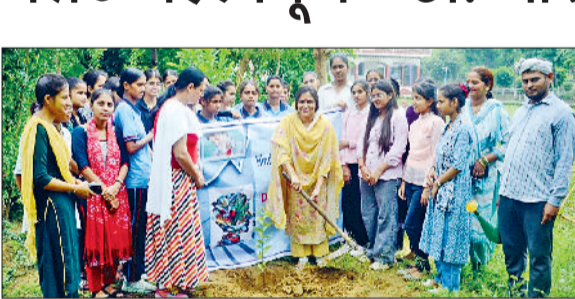
जीद। हिंदू कन्या महाविद्यालय में पौधारोपण करते हुए।

जिला में नशा मुक्त भारत अभियान के तहत लगातार गतिविधियां संचालित की जा रही हैं। जिला को नशा मुक्त बनाने की पहल में स्कूलों और कॉलेजों के विद्यार्थियों को भाग लेने और भविष्य में नशा से दूर रहने के लिए प्रोत्साहित किया जा रहा है। इसी कड़ी में हिंदू कन्या महाविद्यालय में नशा मुक्त भारत अभियान के तहत एंटी-ड्रग्स अवेयरनेस सेल द्वारा पौधारोपण कार्यक्रम आयोजित किया गया। जिसने छात्राओं को पर्यावरण संरक्षण के साथ-साथ नशा मुक्त