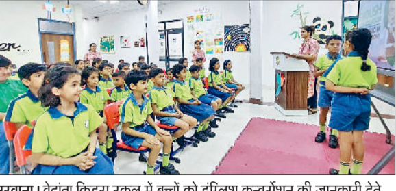
नरवाना। वेदांता किड्स स्कूल में बच्चों को इंग्लिश कन्वर्सेशन की जानकारी देते हुए अध्यापक।