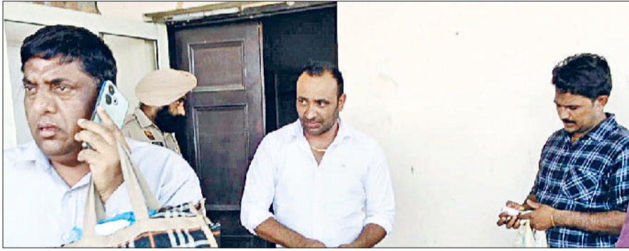
गुहला। प्रतिष्ठान को सील करने वाली टीम और सील किया गया प्रतिष्ठान।