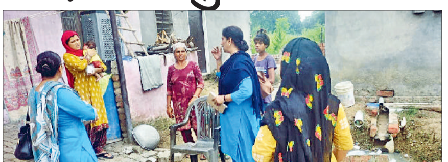
जीद। मौसमी बीमारियों को लेकर जागरूक करते हुए स्वास्थ्यकर्मियों।