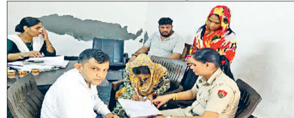
जींद। मौके पर कार्रवाई करते टीम।