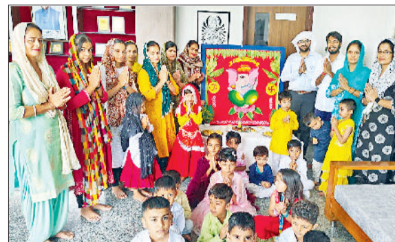
जीद। कार्यक्रम में भाग लेते बच्चे।