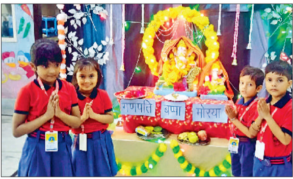
जीद। भगवान गणपति की पूजा करते श्रद्धालु।